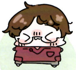
まつだせんせい 言語聴覚士 (ST)