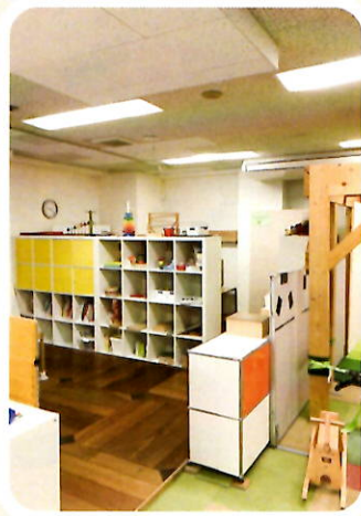
支援スペース [絵本とおもちゃのコーナー]

主に言語聴覚士が専門スタッフです。 言葉や発声、コミュニケーションに対して 特性や傾向にあわせた支援をします。