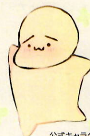
公式キャラクター まゆげ〜ん