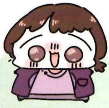
よしだせんせい 言語聴覚士 (ST)

主に作業療法士が専門スタッフです。 行動や遊び、生活に対して 特性や傾向にあわせた支援をします。