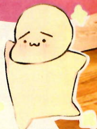
公式キャラクター まゆげ〜ん

アクティブキッズは 発達成長が気になるお子さまの 児童発達支援・ 放課後等デイサービス (通所支援)と 保育所等訪問 (訪問支援) の ケアを行う施設です