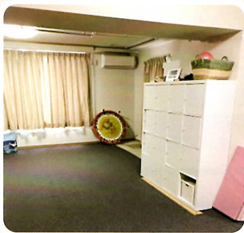
オープンスペース