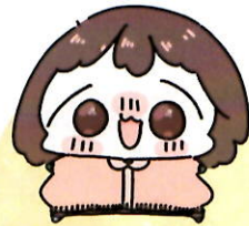
たけだせんせい 作業療法士 (OT)