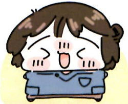
みかみせんせい 作業療法士 (OT)