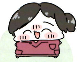
たいらせんせい 言語聴覚士 (ST)

主に言語聴覚士が専門スタッフです。 言葉や発声、コミュニケーションに対して 特性や傾向にあわせた支援をします。