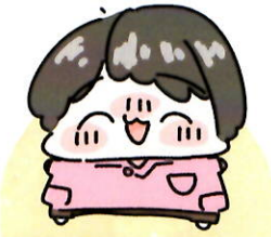
たけうちせんせい 作業療法士 (OT)

主に作業療法士が専門スタッフです。 行動や遊び、生活に対して 特性や傾向にあわせた支援をします。