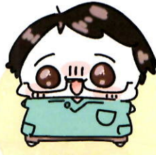
ほそかわせんせい 作業療法士 (OT)