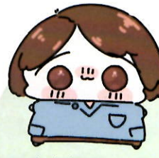
ささきせんせい 言語聴覚士 (ST)